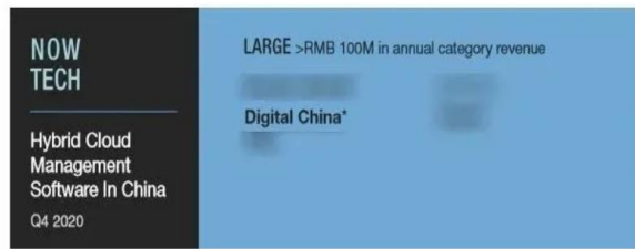
FIGURE 1 Now Tech Market Presence Segments: Hybrid Cloud Management Software In China, Q4 2020