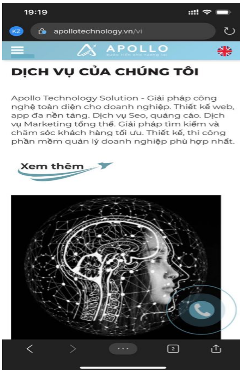
Trang chủ Apollo - Giao diện điện thoại