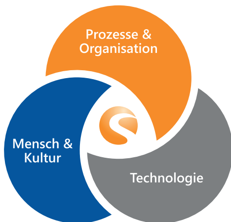
Abb.: Digitalisierung am Sweetspot der Transformation

PROZESSE & ORGANISATION: Ihr Unternehmen lernt agile Methoden besser kennen und anwenden. Damit sind Sie in der Lage, bei der Umsetzung digitaler Prozesse schrittweise vorzugehen und immer wieder zu überprüfen, ob Sie noch auf dem richtigen Weg sind. Außerdem sind Sie flexibler, um bei Bedarf jederzeit auf neue Herausforderungen zu reagieren.