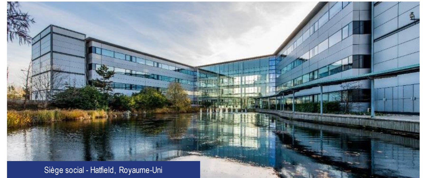
Siège social - Hatfield, Royaume-Uni

Nous délivrons nos prestations et supportons nos clients dans 45 autres pays