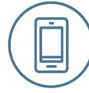
Mobile & Awareness