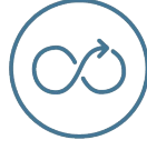
Digital transformation & Co-Innovation Labs