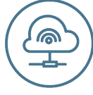
IoT & Automation