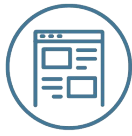
Web App & UI/UX