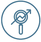
BigData, BI & Data Management