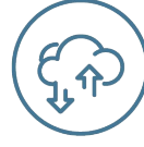
Cloud Strategies & Devops