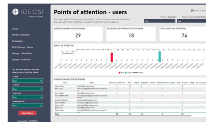
Vue pour les administrateurs (PowerBI)