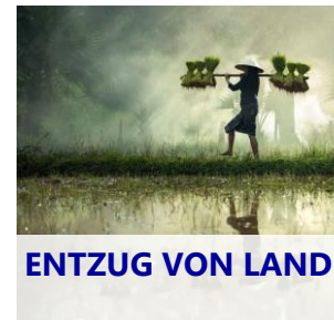
ENTZUG VON LAND