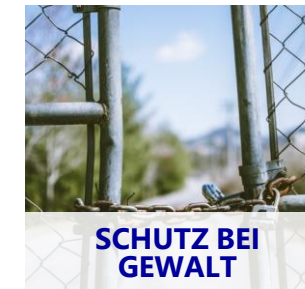
SCHUTZ BEI GEWALT