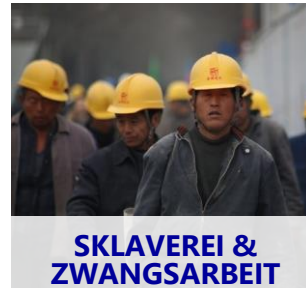
SKLAVEREI & ZWANGSARBEIT