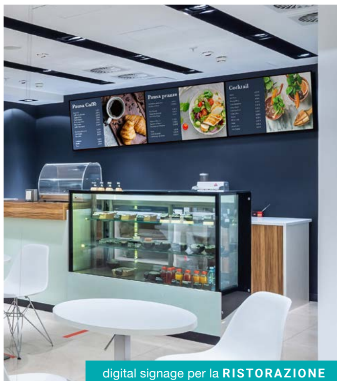
digital signage per la RISTORAZIONE