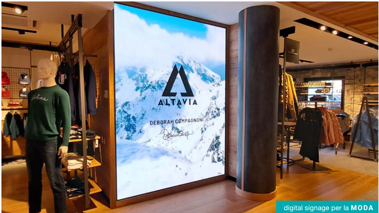
digital signage per la MODA

Attira facilmente l'attenzione delle persone che contano di più.