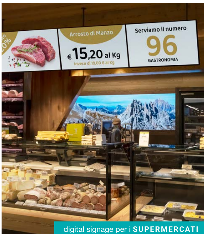
digital signage per i SUPERMERCATI