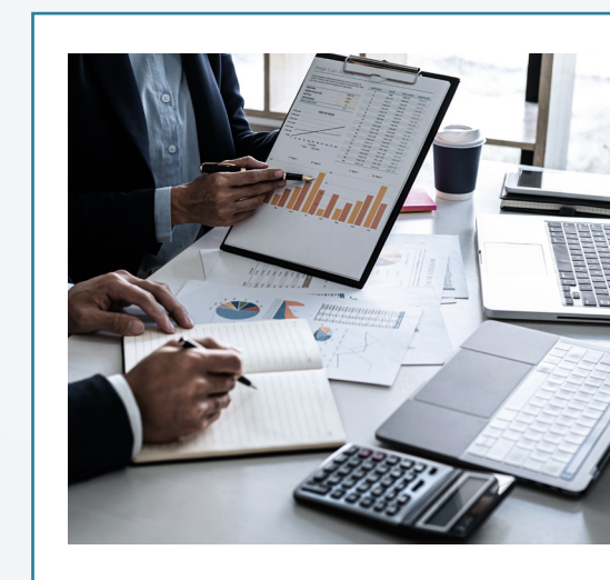
設計から移行そして保守 戦略をトータルサポート